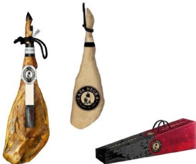
Jamón de Cebo 50% Ibérico