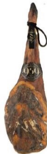
Paleta de Bellota 100% Ibérico 959 5 kg aprox.