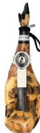
Paleta de Cebo 50% Ibérico