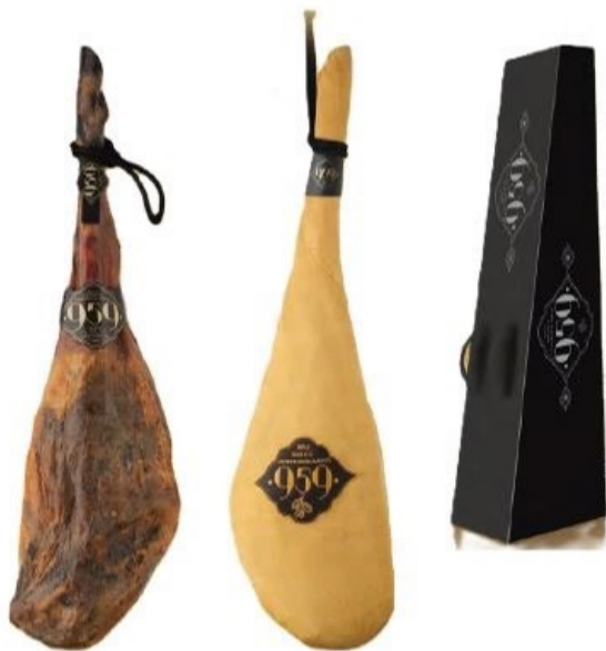
Jamón de Bellota 100% Ibérico 959 7 kg aprox.